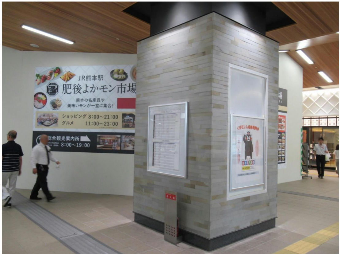
下浦石 使用例2_熊本駅(柱)