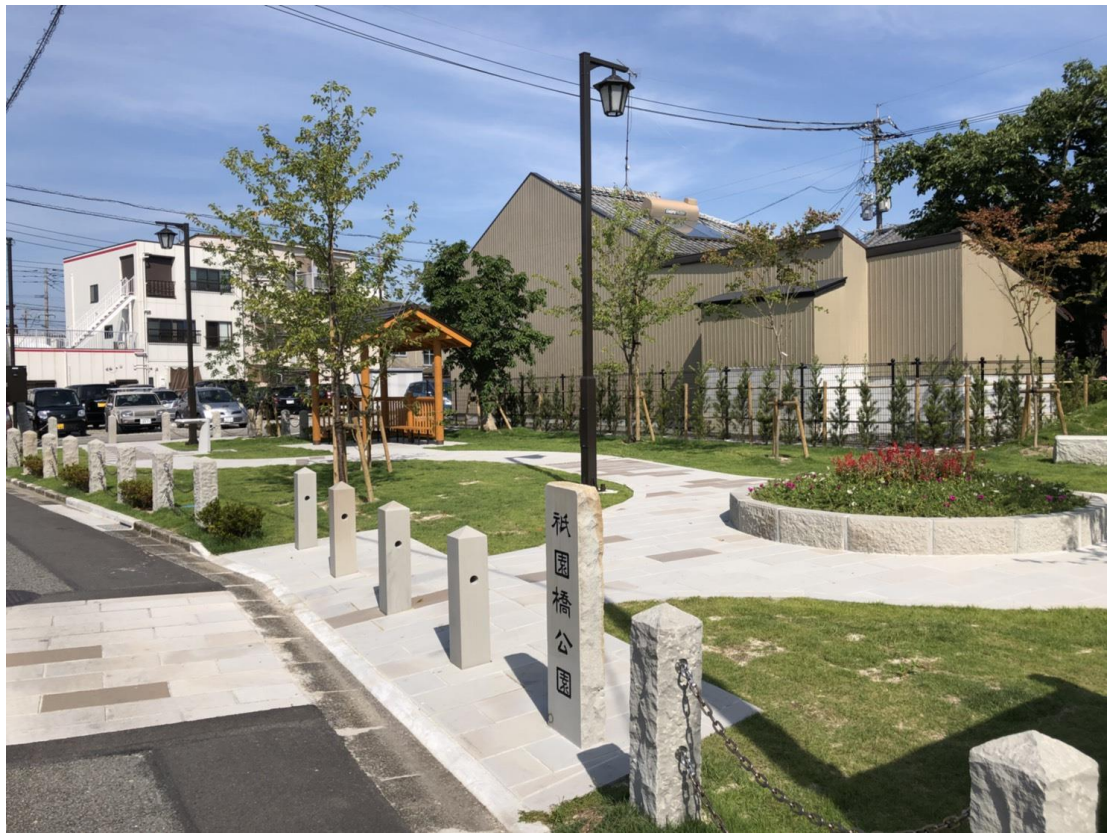
下浦石 使用例1_公園